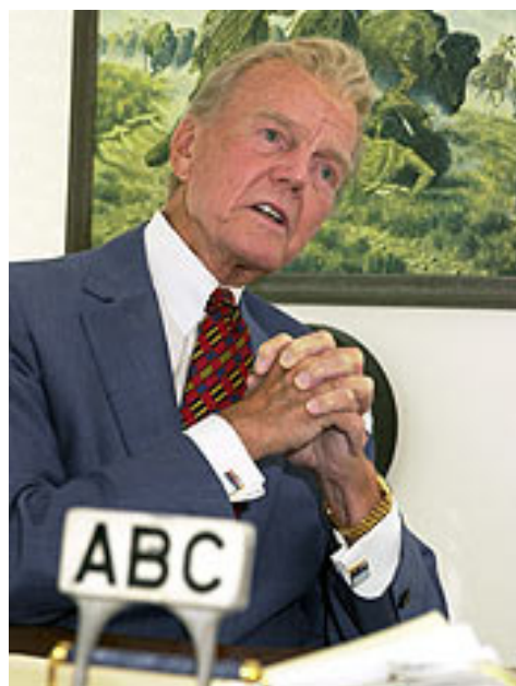
comentarista Paul Harvey

O comentarista Paul Harvey difundiu esta oração na sua emissão de rádio “ The Rest of the Story”, (O Resto da História), e recebeu um acolhimento muito mais favorável por esta emissão, que por qualquer outra.