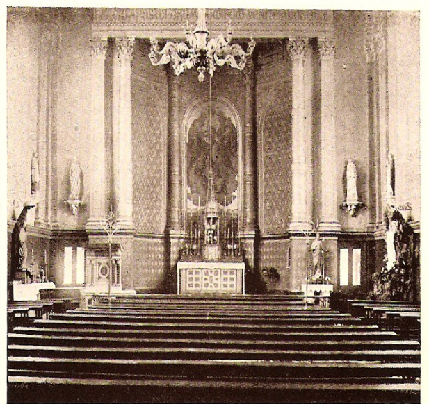
OLD WILLOW LANE CHAPEL (INTERIOR).