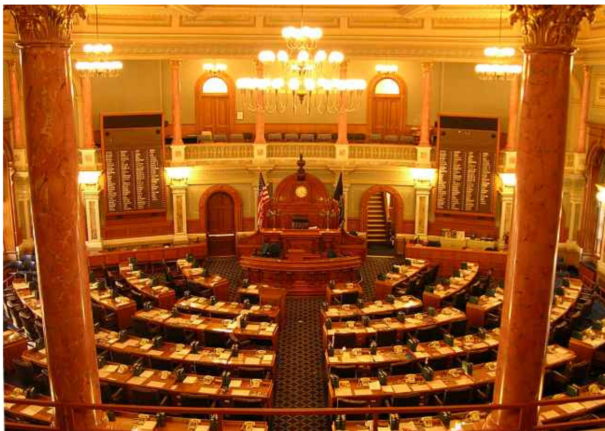
Kansas House of Representatives